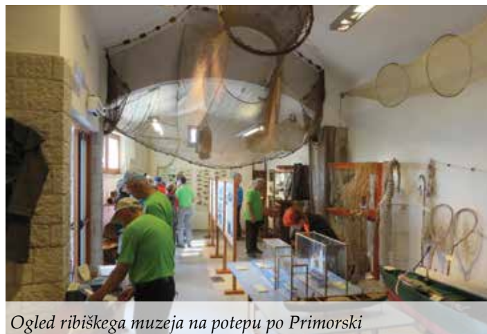
Ogled ribiškega muzeja na potepu po Primorski

Od izletov, ki sledijo, bi morda omenil še Ajdno v bližini Jesenic, ki je do sedaj kljub majhni, a po gorah bogati Sloveniji še nismo obiskali. Ne smem pozabiti na Peco – tudi to bomo obiskali skupaj z našimi prijatelji planinci iz Lipnice. Na izlet v neznano se bomo, kot vsako leto podali v mesecu novembru. Kam nas bo tokrat vodila pot? V neznano. Omenjeni so samo izleti oziroma pohodi, ki nekako bolj izstopajo, v načrtu jih je mnogo več. Naj omenim samo nočne pohode, ki jih prirejamo vsak mesec ob koncu tedna na dan, ki je najbližji polni luni. Teh pohodov se je nabralo že krepko preko dvesto in z njimi bomo nadaljevali tudi v bodoče. Iščemo vedno nove variante dostopov do naših postojank, da pohodi ne bi