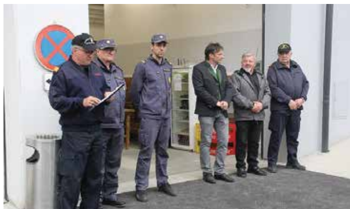
Ob razglasitvi rezultatov

avstrijska gasilska odlikovanja, pa tudi sami smo poskrbeli, da njihovi zaslužni člani nosijo naša odlikovanja in priznanja. Že trinajsto leto je stalnica našega sodelovanja vsakoletna čezmejna vaja v orientaciji. Terensko je sestavljena tako, da del vaje poteka na naši, del pa na avstrijski strani. Tako tekmovalci spoznavajo širše območje, kar bi nam znalo koristiti v resnih primerih katastrof večjih razsežnosti. Letošnjega tekmovanja smo se udeležili s štirimi ekipami. Žal je tudi letos izostala ekipa, ki je na skoraj vseh vajah oz. tekmovanjih dosegala vrhunske rezultate in proa mesta.