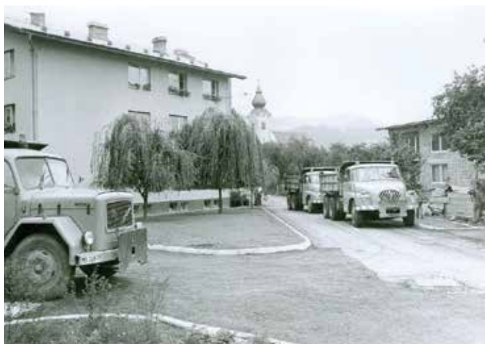
Asfaltiranje uvoza v Gasilsko ulico