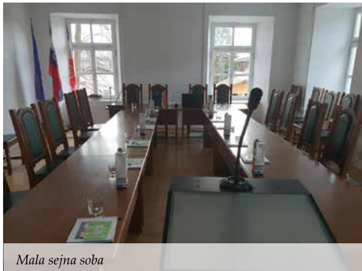
Mala sejna soba

Celovita obnova graščine Kienhofen, ki zajema tudi že v letu 2014 zamenjano strešno konstrukcijo ter pripravljajna dela za ureditev večnamenske dvorane v mansardnem delu stavbe, bo znašala kar dobrih 1,6 mio EUR. Za projekt smo uspešno pridobili sredstva iz proračuna RS in Kohezijskega sklada EU v višini dobrih 640.000 EUR.