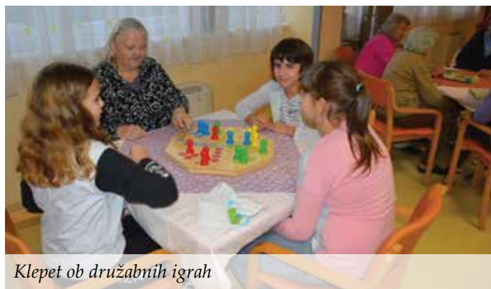
Klepet ob družabnih igrah