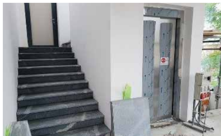
Prizidek z dvigalom in stopniščem

V sredini lanskega leta se je pričela tudi obnova notranjih prostorov stavbe v prvem nadstropju ter gradnja prizidka z dvigalom.