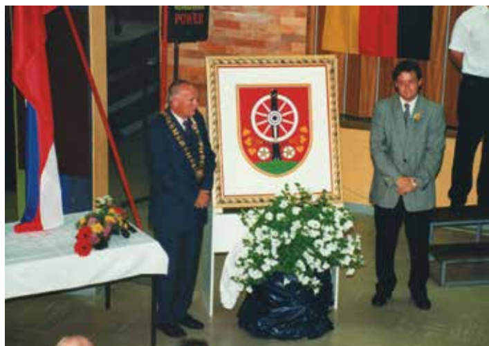
Predstavitve novega uradnega grba občine po heraldičnih predpisih, 1998