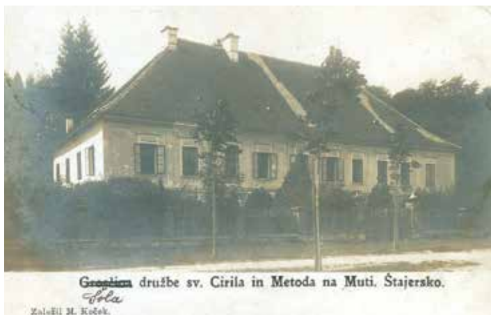
Šola Cirila in Metoda na Muti – današnja občinska stavba leta 1900

Mnogo je trenutkov, dogodkov iz življenja in pogledov na naš kraj oz. občino, ki so se skozi desetletja ujeli v fotografski objektiv. Majhen izbor vam predstavljamo ob 25. obletnici občine in v bodoče tudi v prihodnjih številkah našega »mučkega« glasila. Bralce Mučana pa vabimo k aktivnemu sodelovanju pri oblikovanju posebne rubrike »Muta skozi čas«. Pobrskajte po svojih domačih arhivih, mogoče se najde kakšna prav zanimiva fotografija, ki jo bomo skupaj s podatki z veseljem objavili.