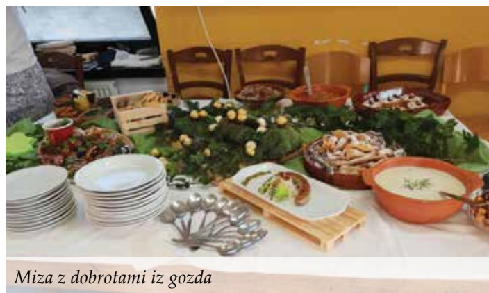
Miza z dobrotami iz gozda

V lanskem šolskem letu smo na temeljih dosedanjih izkušenj začeli oblikovati nov mozaik. Smo na začetku ustvarjanja in ti drobni kamenčki so postavljeni kot okvir za nadaljnje delo; morda bomo kdaj katerega predstavili ali celo zamenjali ... Projekt Gozd – zelo splošna tematika, že od daleč se vidi vključenost vseh programov. Prav vse funkcije gozda lahko proučimo z našimi programi. S postavitvijo dveh začetkov poti in povezavami smo želeli poudariti, da je naša šola lep in bogat mešan gozd, naši programi skupine dreves v gozdu, vsak posameznik, dijak/-inja, učitelj/-ica, pa drevesa v tem gozdu.