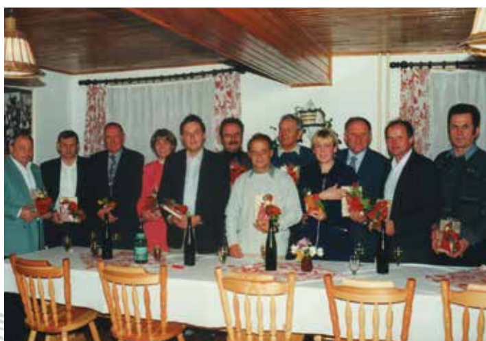
Prvi občinski svet Občine Muta v mandatu 1994–1998