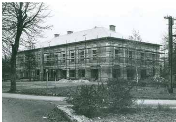
Graščina Kienhofen, adaptacija