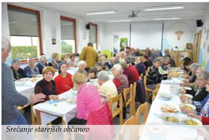
Srečanje starejših občanov

V letošnjem letu smo poleg rednih aktivnosti (delitev hrane, dežurstvo in urejanje v skladišču oblačil, čiščenje cerkve in župnišča, udeležba na izobraževanjih, obiski starejših in bolnikov, postne akcije, praznovanje dneva staršev ...) organizirali še nekaj večjih dogodkov.