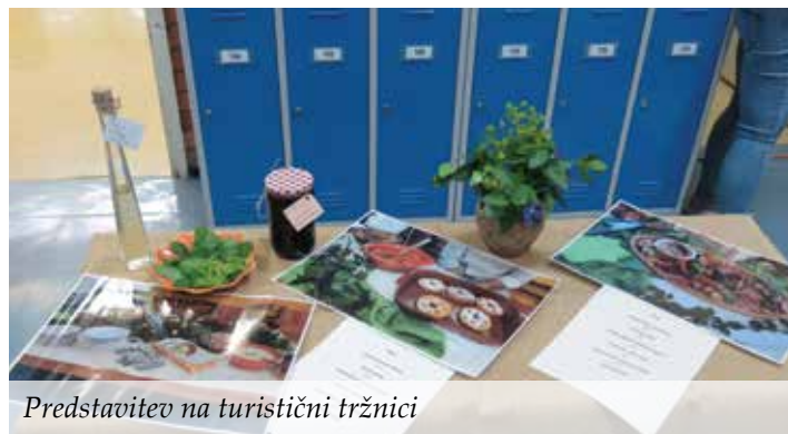
Predstavitve na turistični tržnici

Turistična zveza Slovenije je v sredo, 30. januarja 2019, v okviru sejma NATOUR Alpe-Adria 2018/19 gostila tudi festival Več znanja za več turizma na temo Turistični spominek mojega kraja. Na festivalu se je s predstavitvijo na turistični tržnici predstavilo več kot 40 srednjih šol iz vse Slovenije in tujine.