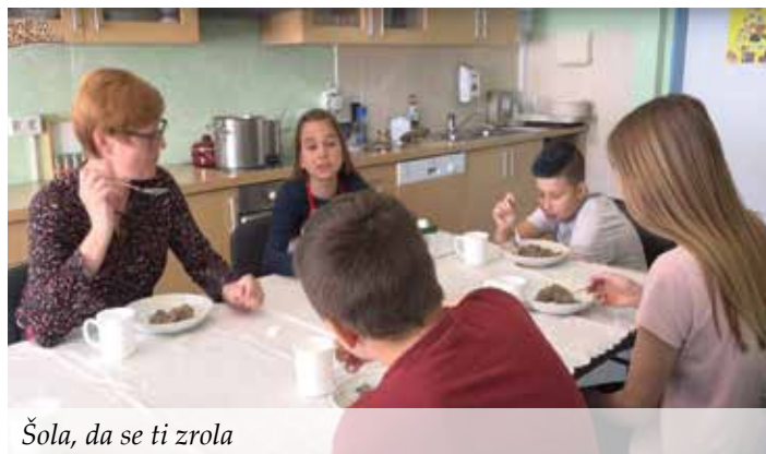
Šola, da se ti zrola

»Med snemanjem sem se počutil super, ker sem lahko nastopal. Bilo je zabavno, saj sem bil prvič v vlogi televizijskega voditelja. Kuhali smo ajdove žgance in jih na koncu pojedli. Upam, da bom v oddaji lahko sodeloval tudi prihodnje leto.«