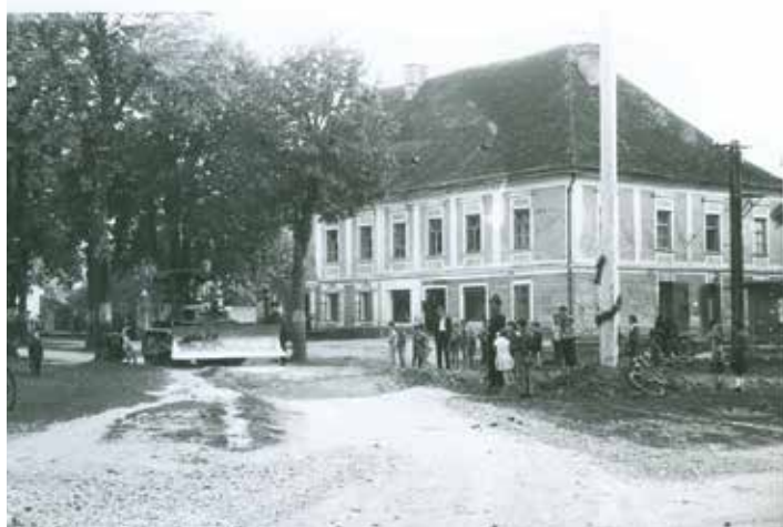
Graščina Kienhofen v začetku 60. let