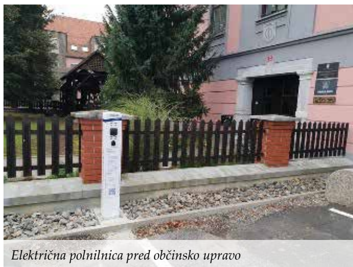
Električna polnilnica pred občinsko upravo