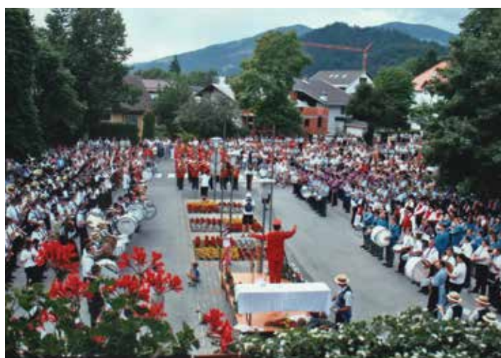
Tekmovanje v korakanju godb, 2005