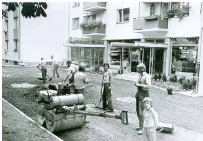
Asfaltiranje Glavnega trga 2–4 v 80. letih