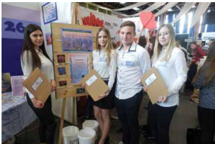
Dijaki na sejmju ob stojnici našega učnega podjetja

Marca se je v Celju odvijal 13. mednarodni sejem učnih podjetij, na katerem je istočasno potekalo tudi državno tekmovanje učnih podjetij. Od leta 2006, ko je potekal 1. sejem učnih podjetij, se je veliko spremenilo: dogajanje se je priključilo veliko tujih učnih podjetij, stojnice so iz leta v leto boljše, lepše, ideje izvirnejše, učna podjetja pa pripravijo tudi interaktivno promocijsko gradivo. Na sejmju je sodelovalo 56 učnih podjetij iz Slovenije, Črne gore, Avstrije, Hrvaške, Romunije in Italije. Med njimi je bilo tudi naše podjetje Lavandula, d. o. o., ki se ukvarja s prodajo izdelkov iz sivke. S pripravami so začeli januarja, ko so zmagali na šolskem tekmovanju učnih podjetij. Pripravili so veliko propagandnega materiala: poslovni načrt, radijsko reklamo, powerpoint predstavitev podjetja, spletno in Facebook stran, razne ponudbe, reklame letake, zloženko podjetja, račune, pogodbe, nagradno igro ... Tudi letos je deloval sejemski radio, preko katerega so se predstavljala učna podjetja. Zadovoljni so bili tako s svojo predstavitvijo kot z obsegom prodaje. Pridobili so veliko izkušenj, ki jim bodo v življenju prišla zelo prav. Izkazali so se kot odlični, samozavestni poslovneži in zelo dobri retoriki, ki se znajdejo v vsaki situaciji.