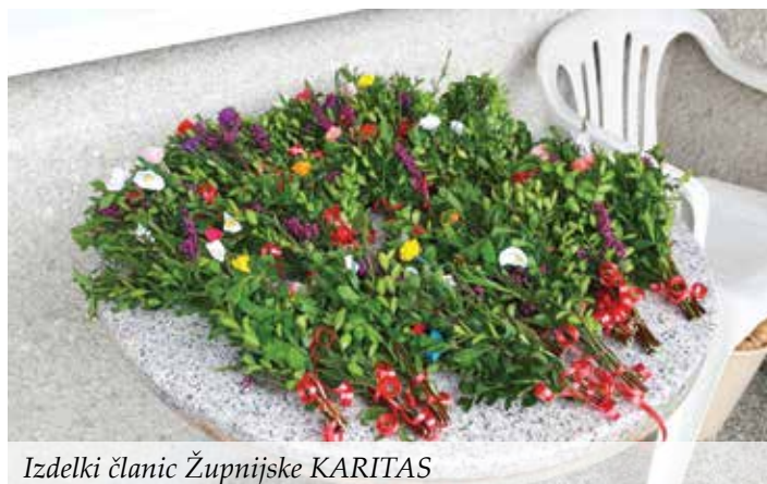
Izdelki članic Župnijske KARITAS