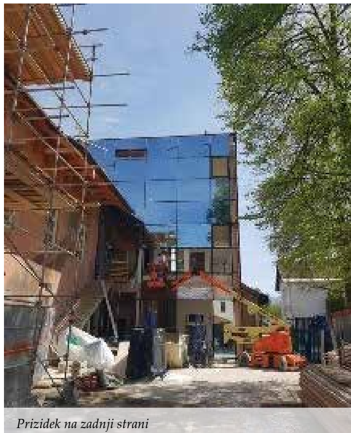
Prizidek na zadnji strani