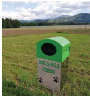
Nameščeni koši za pasje iztrebke

S tem boste pripomogli k varni pridelavi hrane, vzreji živine ter zdravemu in uspešnemu kmetovanju naših kmetov, ki so od teh dejavnosti tudi živiljenjsko odvisni.