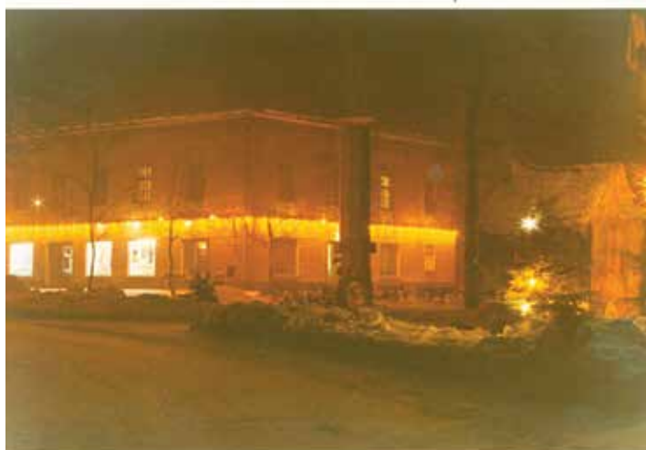
Graščina Kienhofen v soju prazničnih luči, 6. 1. 1972