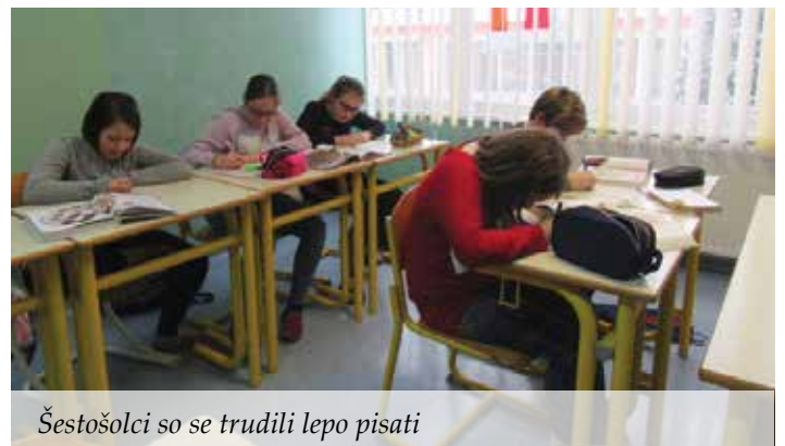
Šestošolci so se trudili lepo pisati

S pisanjem z roko razvijamo motorične spretnosti, ki pa so se z razvojem tehnologije predvsem pri otrocih zelo zmanjšale. To opažamo tudi učitelji, saj pisanje z roko predstavlja za učence že pravi fizični napor. Njihova pisava je okorna in zato nečitljiva. Pisanje z roko je pomembna spretnost, ki jo razvijamo z vajo. Strokovnjaki tudi ugotavljajo, da naši možgani bolje delujejo pri pisanju z roko kot pri pisanju z računalnikom. Informacija, ki jo napišemo z roko, se v spominu zadrži dlje časa. Pri pisanju z roko se nam utrne več idej, ohranjamo pa tudi dolgotrajnejšo pozornost. Pisanje z roko je tudi bolj osebno, z njim spodbujamo izražanje spoštovanja in naklonjenosti. Društvo Radi pišemo z roko želi z razpisom ob vsem zapisanem pomembno vplivati na razvoj individualnosti, saj je pisava vsakega človeka neponovljiva, in vzpostaviti družbeno pozitiven odnos do pisanja z roko, ne