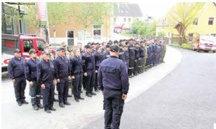
Postrojeni gasilci po zaključku tekmovanja

Pisali smo nekako šestdeseta leta prejšnjega stoletja, ko so poveljniki in vodstva obmejnih gasilskih društev pričela iskati stike z gasilci z druge strani, takrat še za trdo zaprtimi »rampami« severne države meje. Je le treba poudariti, da so se posamezniki izjemno trudili, da so vzpostavili dokaj stalne stike in kmalu tudi prve skupne gasilske vaje in tekmovanja. Če na drugi strani ne bi našli tako pozitivnega odziva, vsega tega lepega in koristnega sodelovanja sploh ne bi bilo. Ne samo vodstev posameznih društev, tudi županov, ki so na drugi strani imeli kar veljavno besedo, ne smemo prezreti. Ostaja nam v spominu, koliko seznamov ekip, spremljevalcev (v začetku celo s slikami) smo morali predložiti našim državnim organom. Vedno smo imeli ob vajah zagotovljeno tudi »varstvo« miličnikov in še koga. Zanimivo, jezik in »komande« nam niso delale težav, nekako smo se sporazumevali in sodelovali. Kar hitro smo ugotovljali slabosti in prednosti, tako na naši strani kot na njihovi. Izkušnje, pridobljene na teh vajah, s pridom uporabljamo še danes. Pa še zanimivost. Ko smo se po vaji odpravili k »zasluženemu« odmoru, so se po drugi ali tretji pijači mnogi, predvsem starejši, »spomnili«, da še kar obvladajo jezik, ki so ga nekoč uporabljali med sosedi. Če kaj, nam je članstvo v Evropski uniji prineslo, da si sosed s sosedom upa spregovoriti v jeziku, ki ga pač obvlada.