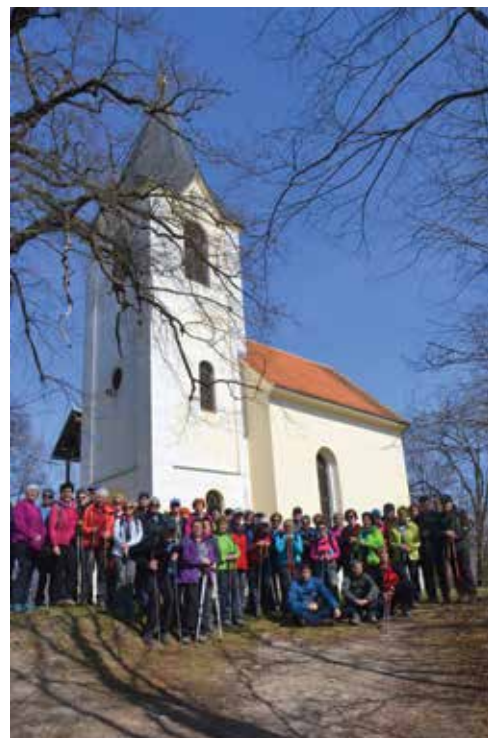
Pri cerkvi sv. Tomaža nad Vojnikom

postali dolgočasni. Tu so še pohod od doma na Uršljo goro, pa od doma na Triglav, ki ga nameravajo naši člani podaljšati še do delčka našega morja, kar bo res velik zalogaj (predvsem kondicijsko), ki pa ga zmore le peščica naših članov. Zanimivo, da smo kljub letošnjemu muhastemu vremenu izvedli vse do konca maja načrtovane pohode in samo upamo lahko, da nas bo takšna sreča spremljala tudi v nadaljevanju leta. Naše aktionosti so pestre in bogate, predvsem pa koristne za dušo in telo. Vabimo vas v naše vrste. Pogrešamo predvsem mlajšo populacijo. Vemo, da ste obremenjeni s službami, a naša dejavnost deluje telesu koristno in protistresno, kar vam bo vsekakor dobrodošlo pri ohranjanju vašega zdravlja in uspešnosti v vaših službah.