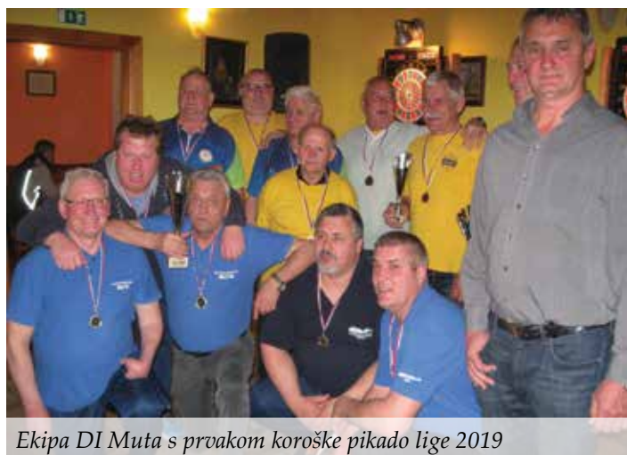
Ekipa DI Muta s prvakom koroške pikado lige 2019

DI Muta pa je znano kot odličen organizator območnih tekmovanj – kvalifikacij za državno prvenstvo – in organizator državnih prvenstev v pikadu in šahu. Tako smo letos 2. februarja uspešno izvedli območno tekmovanje v šahu za koroško in celjsko regijo. Posebno ponosni smo, da nas je ZŠIS (Zveza za šport invalidov Slovenije – Paraolimpijski komite) prosila, da izvedemo jubilejno 15. državno prvenstvo invalidov v pikadu, ki bo potekalo 16. novembra v športni dvorani OŠ Muta. Zgovoren je podatek, da bomo izvajalci državnega prvenstva v pikadu že tretjič, saj smo bili izvajalci že leta 2006 in 2015. Prav tako smo bili leta 2017 izvajalci DP v šahu posamezno. Žal za druge športne panoge, kot so kegljanje, balinanje, streljanje, ribolov, smučanje idr., nimamo pogojev.