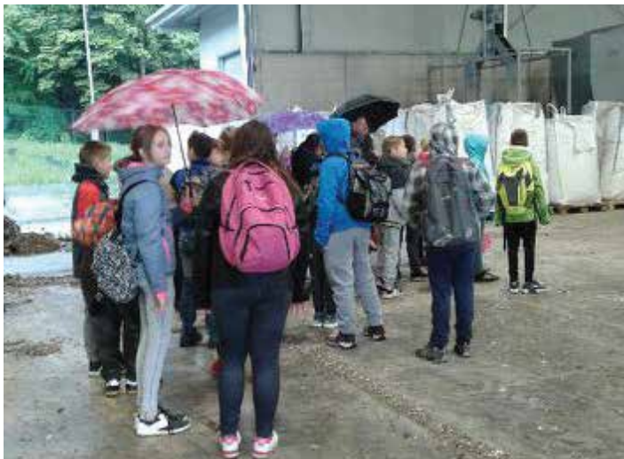
Petošolci v KOCEROD-u

»Gost si na tem planetu, zato se pričakuje od tebe, da boš zapustil takega, kakršnega si našel, ali boljšega. Skrbeti moraš za druge življenjske oblike, ki ne znajo govoriti ali si pomagati. Odgovoren si za obljube, ki jih daješ, za dogovore, ki jih sklepaš, in za rezultate svojih dejanj.« (Marlo Morgan)