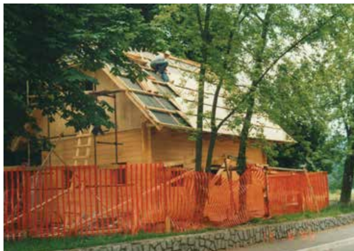
Izgradnja brunarice, 1997