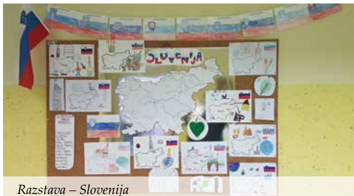
Razstava – Slovenija

V mesecu januarju smo pri podaljšanem bivanju z učenci (1. in 2. razred) spoznavali značilnosti in lepote naše dežele Slovenije. Učenci so v knjižnici in doma poiskali različne knjige o Sloveniji, veliko zanimivosti pa smo našli na spletu. Risali in barvali smo slovensko zastavo. Posebno pozornost smo posvetili grbu in vsem simbolom na njem. Drugošolci so nam zapeli slovensko himno in nas poučili, da jo je napisal naš največji pesnik France Prešeren. Spoznali smo zemljevid Slovenije, ki si ga je s pomočjo šablone narisal vsak in označil glavno mesto – Ljubljano, večja mesta, našo najvišjo goro Triglav in Aljažev stolp na njej. Dodali pa smo, seveda, tudi naš kraj.