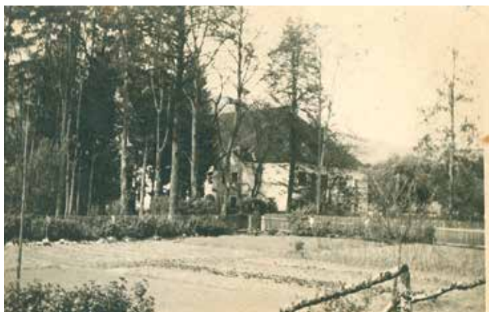
Graščina Kienhofen leta 1937 – pogled z jugozahodne strani