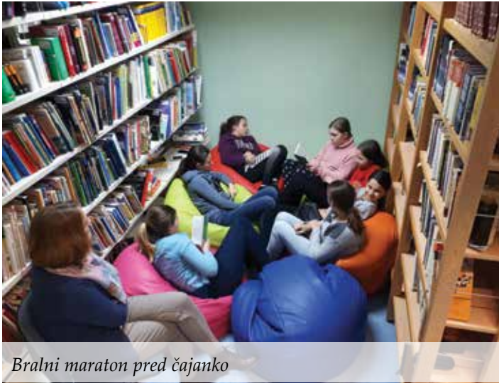
Bralni maraton pred čajanko

jezikovno izražanje ter zraven srkaš čaj in ješ piškote. Naslednje leto bi se na čajankah rada pogovarjala o spletnih zlorabah, ljubezni, o pustolovskih raziskovanjih po svetu in o ljudeh, ki so telesno drugačni od nas.