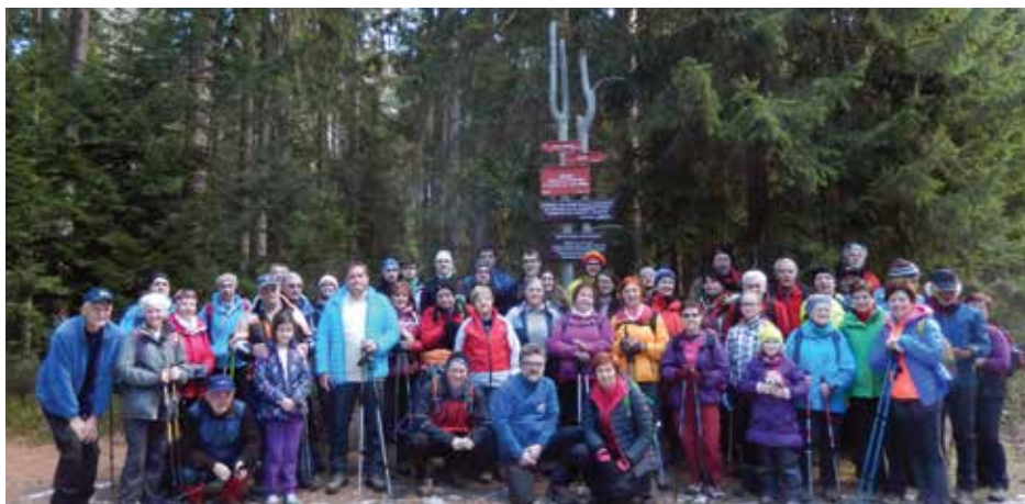
Novoletni pohod na Bricnik

postali dolgočasni. Tu so še pohod od doma na Uršljo goro, pa od doma na Triglav, ki ga nameravajo naši člani podaljšati še do delčka našega morja, kar bo res velik zalogaj (predvsem kondicijsko), ki pa ga zmore le peščica naših članov. Zanimivo, da smo kljub letošnjemu muhastemu vremenu izvedli vse do konca maja načrtovane pohode in samo upamo lahko, da nas bo takšna sreča spremljala tudi v nadaljevanju leta. Naše aktionosti so pestre in bogate, predvsem pa koristne za dušo in telo. Vabimo vas v naše vrste. Pogrešamo predvsem mlajšo populacijo. Vemo, da ste obremenjeni s službami, a naša dejavnost deluje telesu koristno in protistresno, kar vam bo vsekakor dobrodošlo pri ohranjanju vašega zdravlja in uspešnosti v vaših službah.