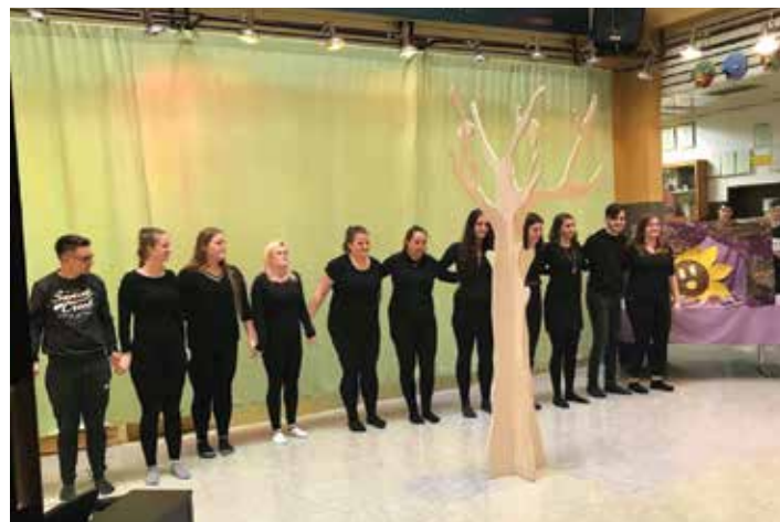
Dijaki predšolske vzgoje na prireditvi

V četrtek, 11. 4. 2019, smo na Muti priredili srečanje, kjer smo na praktičnem usposabljanju gostili ravnateljice in vodje vrtcev, svetovalne delavke ter mentorice dijakov programa predšolska vzgoja. Po uvodnem nagovoru pomočnika ravnatelja in nastopu dijakov ter pogostitvi, ki so jo pripravili dijaki gostinskega programa, so dijaki predstavili svoje izkušnje na praksi v portugalskih vrtcih, kamor so se odpravili v okviru projekta Erasmus+. Seznanili so nas tudi s svojim enodnevnim obiskom v dvojezičnem vrtcu v Globasnici. Sledila je predstavitev rezultatov vprašalnika, ki so jih