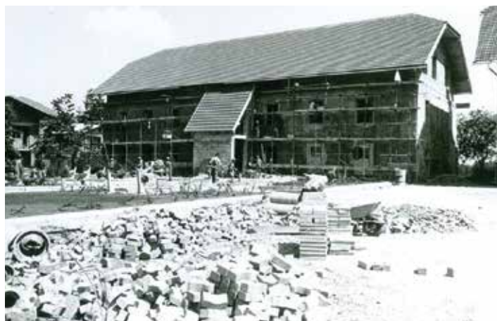
Obnova sedanje OŠPP, bivoši Avguštnski samostan